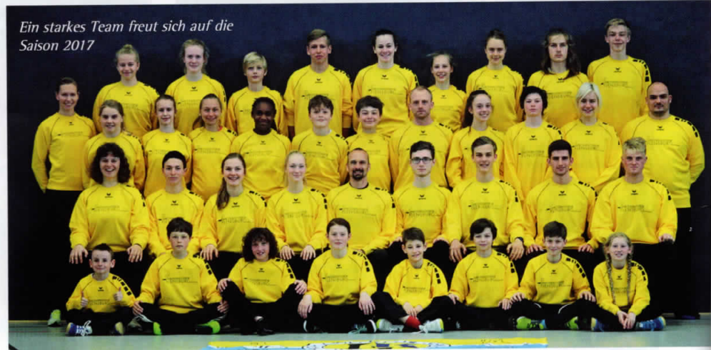
Ein starkes Team freut sich auf die Saison 2017

Zusätzlich zu den normalen Trainingseinheiten wurde eine Spendenfahrt mit dem