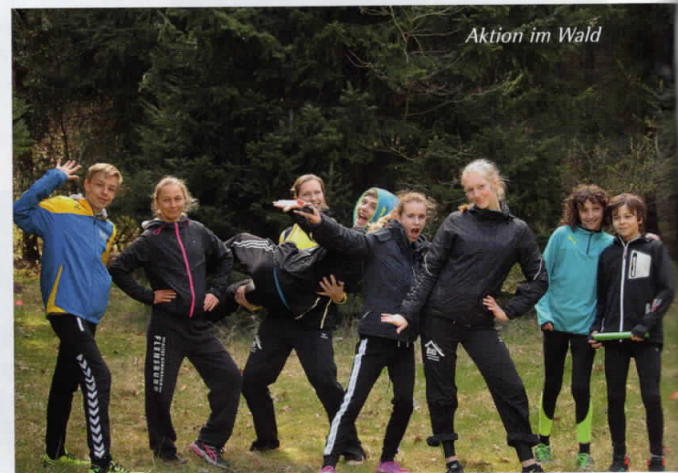
Aktion im Wald