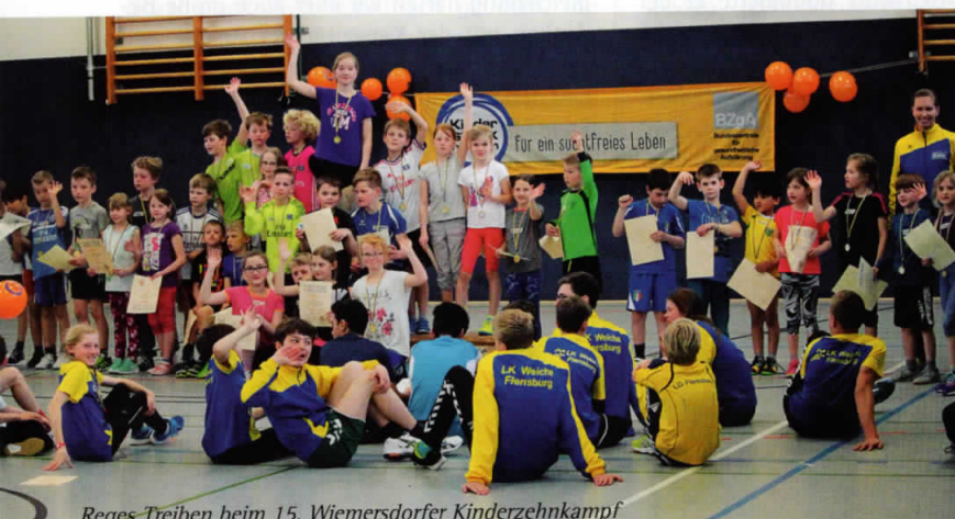
Reges Treiben beim 15. Wiemersdorfer Kinderzehnkampf